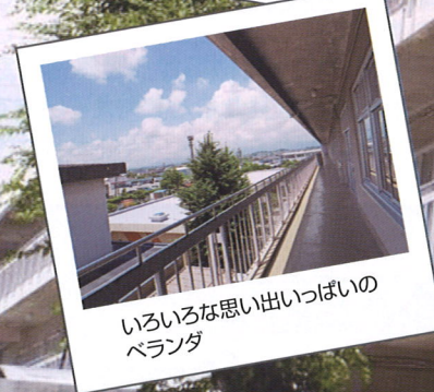
いろいろな思い出いっぱいのベランダ