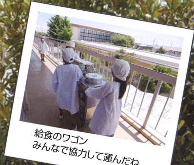
給食のワゴン みんなで協力して運んだね