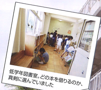
低学年図書室。どの本を借りるのか、真剣に選んでいました