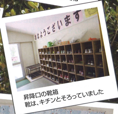
昇降口の靴箱 靴は、キチンとそろっていました