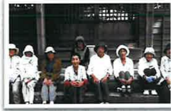
野田若生会 (野田神社)