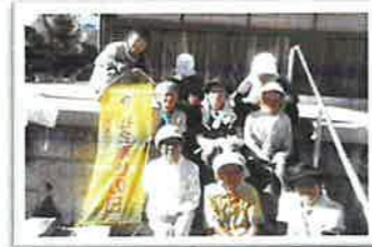
東阿倉川若生会 (海蔵神社)