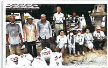
西阿倉川第1・第2若生会 (御厨阿倉川神社)

9月19、20日に海蔵地区連合若生会では、各単位クラブで定められた場所の清掃作業を行いました。早朝から残暑厳しい中、沢山の方に清掃奉仕作業にご協力頂き御礼申し上げます。