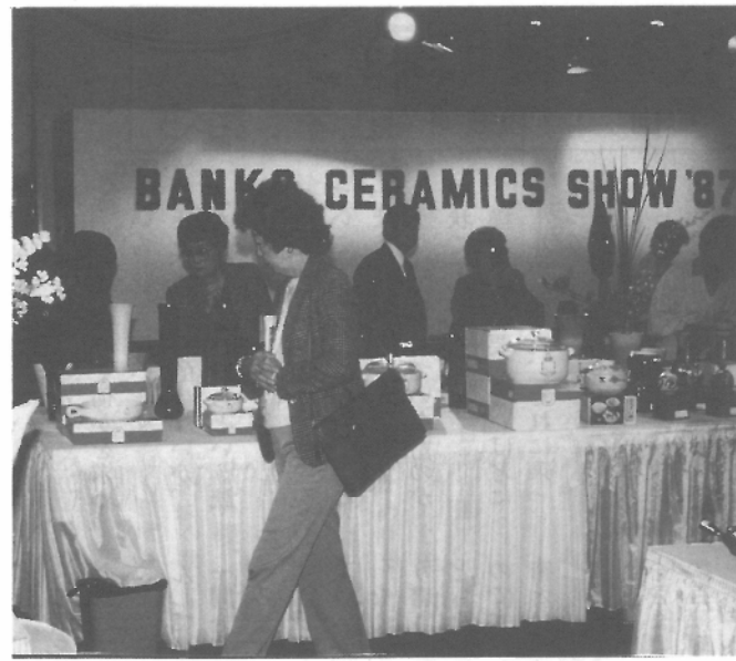
アメリカでの即売会風景