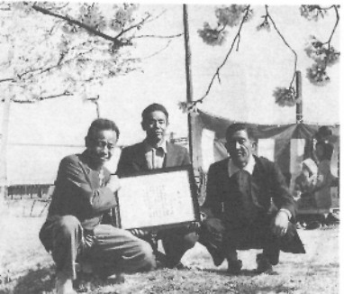
まさに春爛漫 表彰状を手に

現在では、両岸あわせて約千本になり、毎年美しい桜を咲かせ、私たちを楽しませてくれます。残念なことに、最近ではマナーの悪さが目立ちます。皆さんの桜です。いつまでも大切にしましょう。