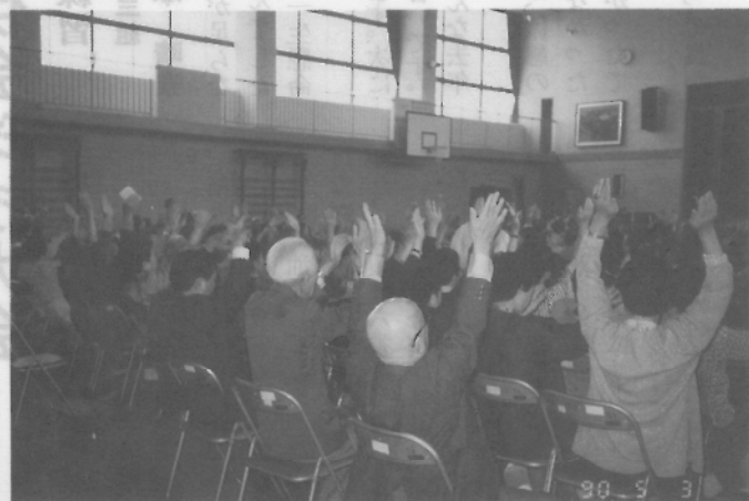
若生会芸能大会 健康体操しましょう