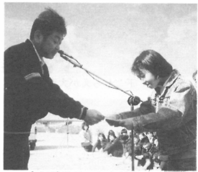
実行委員長から表彰を受ける