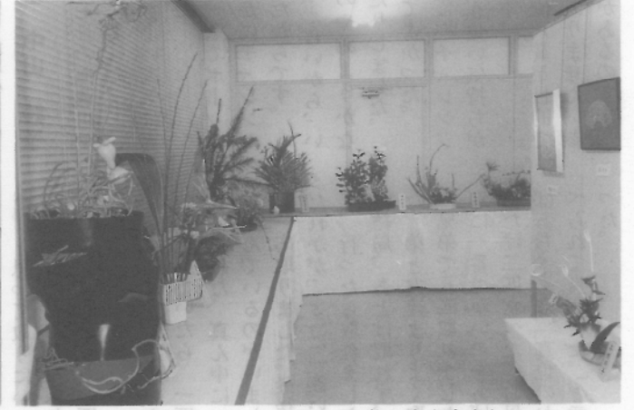
生け花コーナー 文化の日 花も生き生きと