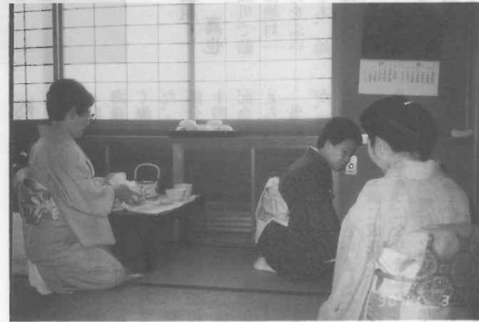
お茶席 一服どうですか？