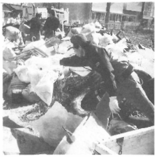
このゴミ誰がすてたの？