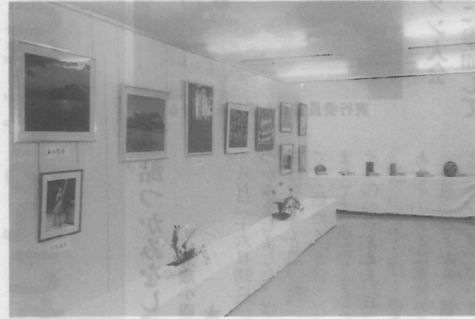
力作がズラリと並びます