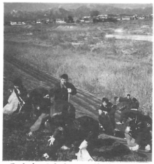
みんなできれいに海蔵川の日

ぼくは、四年生の時から、この清掃活動に参加しているの、だんだんと堤防がきれいになっていくのが良くわかります。 だから、一人一人が心掛けて、故郷の川をゴミの無い美しい川にしていきたいと思っています。