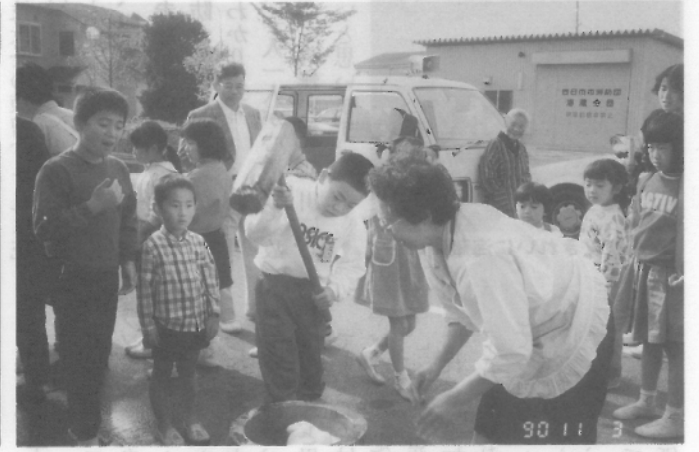
おもちつき 臼をたたかないで！