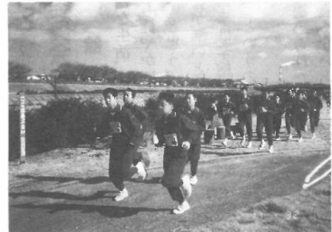
中学生男子は150人が参加

でも、少しは走ってみたいという気持ちもありました。それは、学校のグラウンドでのタイムとマラソンコースでのタイムとどのくらい違うのかわりたかったからです。いざ走ってみると、やっぱり長かったです。マラソンで走ったタイムの方が良かったような気がします。それと、一番印象に残っているのは、僕達のクラスが一番参加人数が多かったことです。やっぱりそれが一番うれしかったです。翌日、先生から感謝状もいただきました。とてもうれしかったです。このマラソン大会に参加して本当に良かったです。