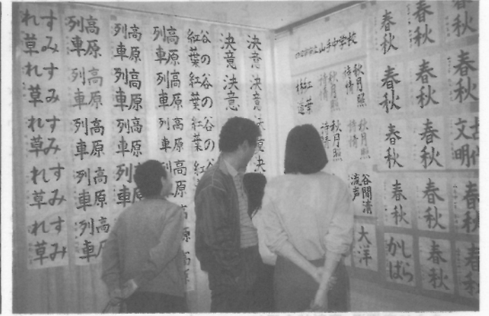
一家そろって「やっぱりうちの子が一番うまいね」