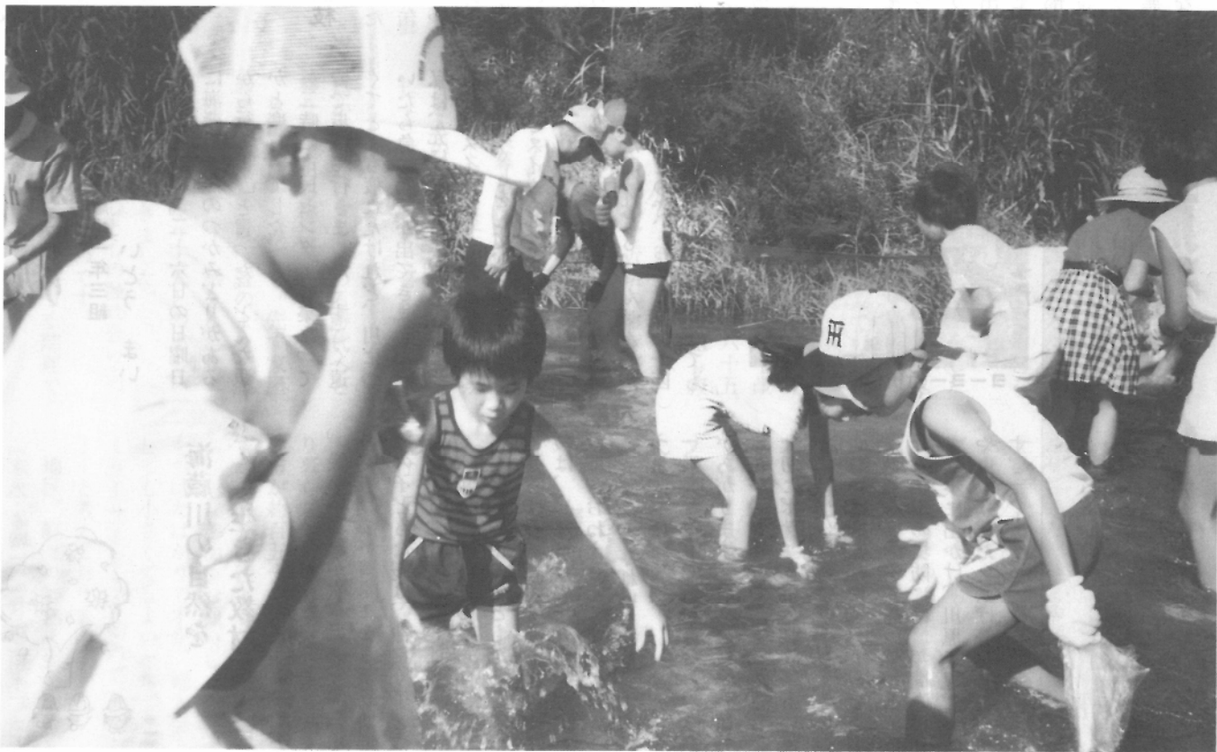
海蔵川にも鮎がいた？ 8月26日(日)鮎の放流つかみどり大会