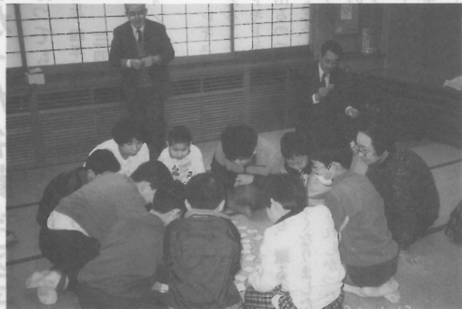
海蔵文庫 新年百人一首大会