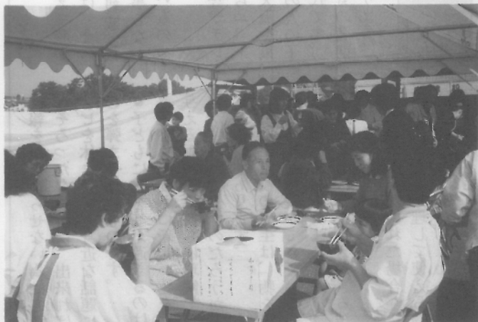
大賑わいの一日目 お味はいかが？