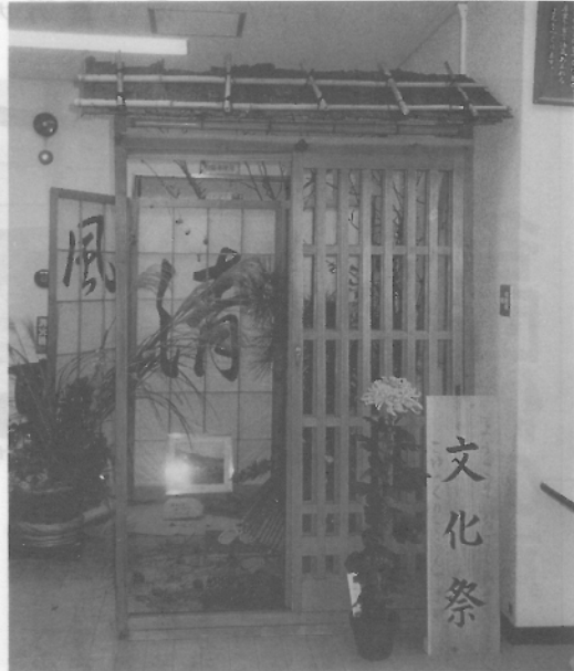
他のセンターでは見られません、この風流さ