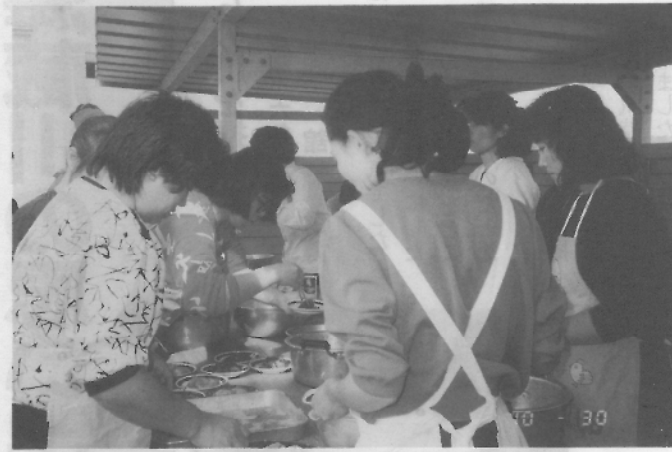
もち ぜんざい 下ごしらえが大変！