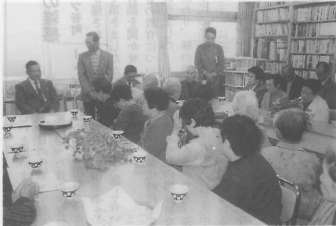
ひとりぐらしのお年寄りを招待