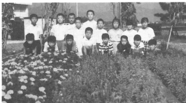
咲き揃った花の前で

ついに花を咲かせたのだ。僕はうれしくなった。花を咲かせるためには一生懸命、世話をしやらないといけないんだ、水やりをさぼると枯れるし、雑草を抜いてやらないとしっかりした株にならないんだということが、この栽培の仕事をして分かった。