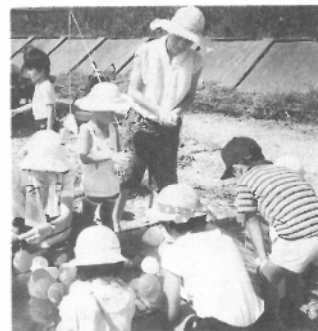
ヨーヨー釣りもしました

二時に市民センターに集まって皆で歩いて行きました。すごく遠くても疲れたけれど、川にいたら急に元気が出てきました。私は、先にヨーヨーをつりました。そしてスイカ割りも初めてしました。目かくしをして、少し不安だったけどスイカをほうで割った時は「やったあ！」と思いました。それから川に入って魚つかみをしました。けれども、ぜんぜんつかめなかったの、おじさんに一匹もらって家に帰りました。とても楽しい一日でした。