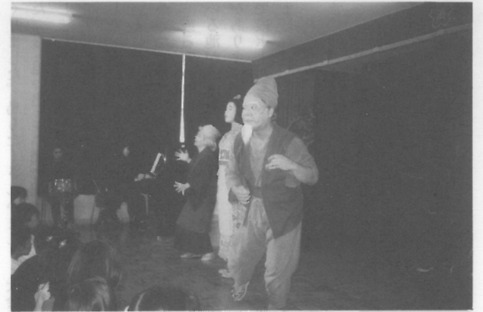
オペラ「うりこ姫とあまんじゃく」